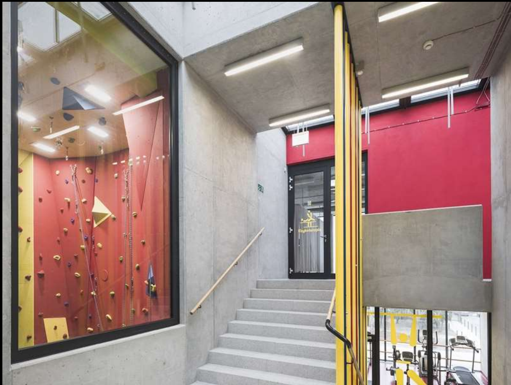
Hala Sportowa ZSOMS