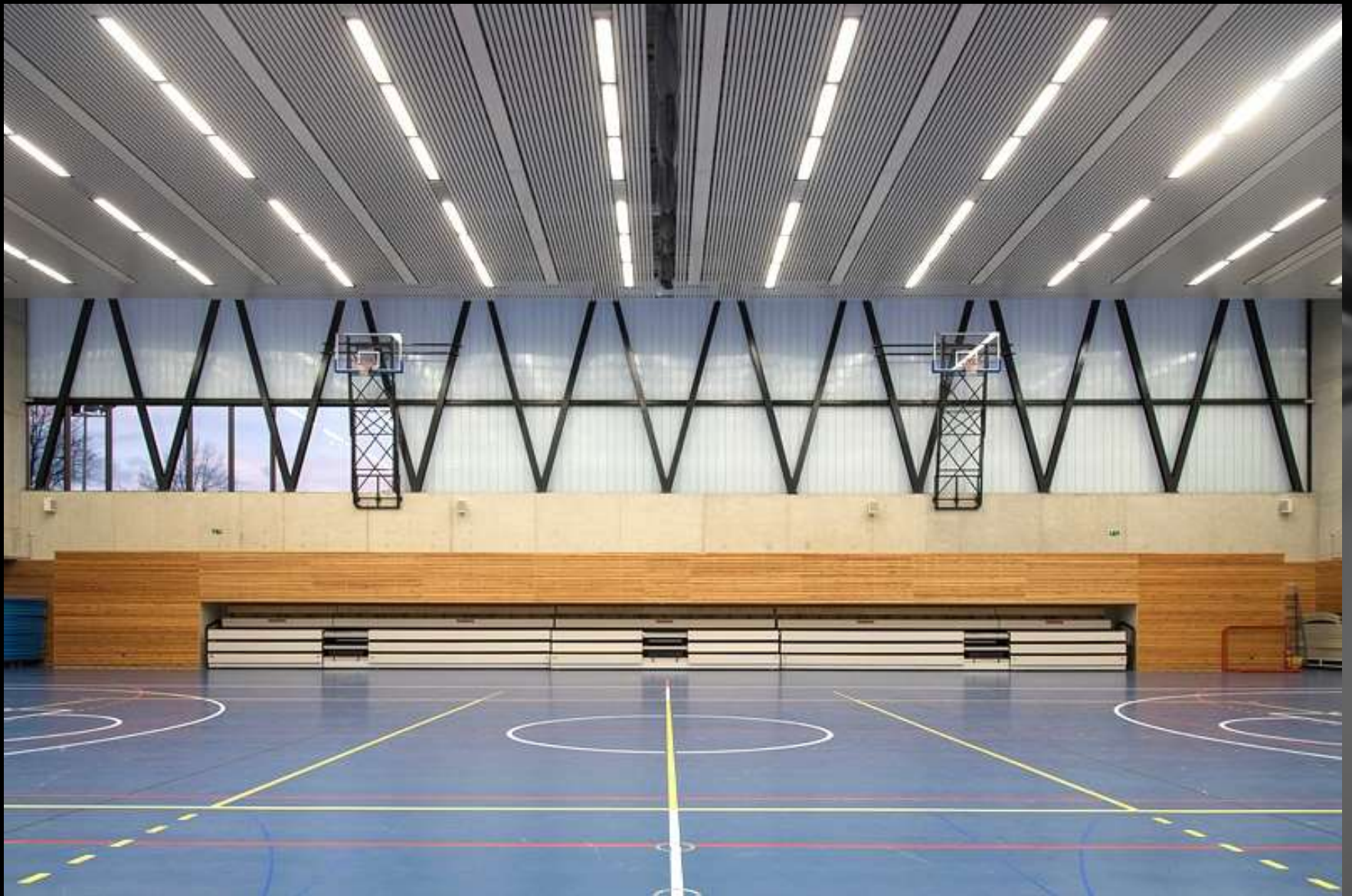
Hala Sportowa ZSOMS