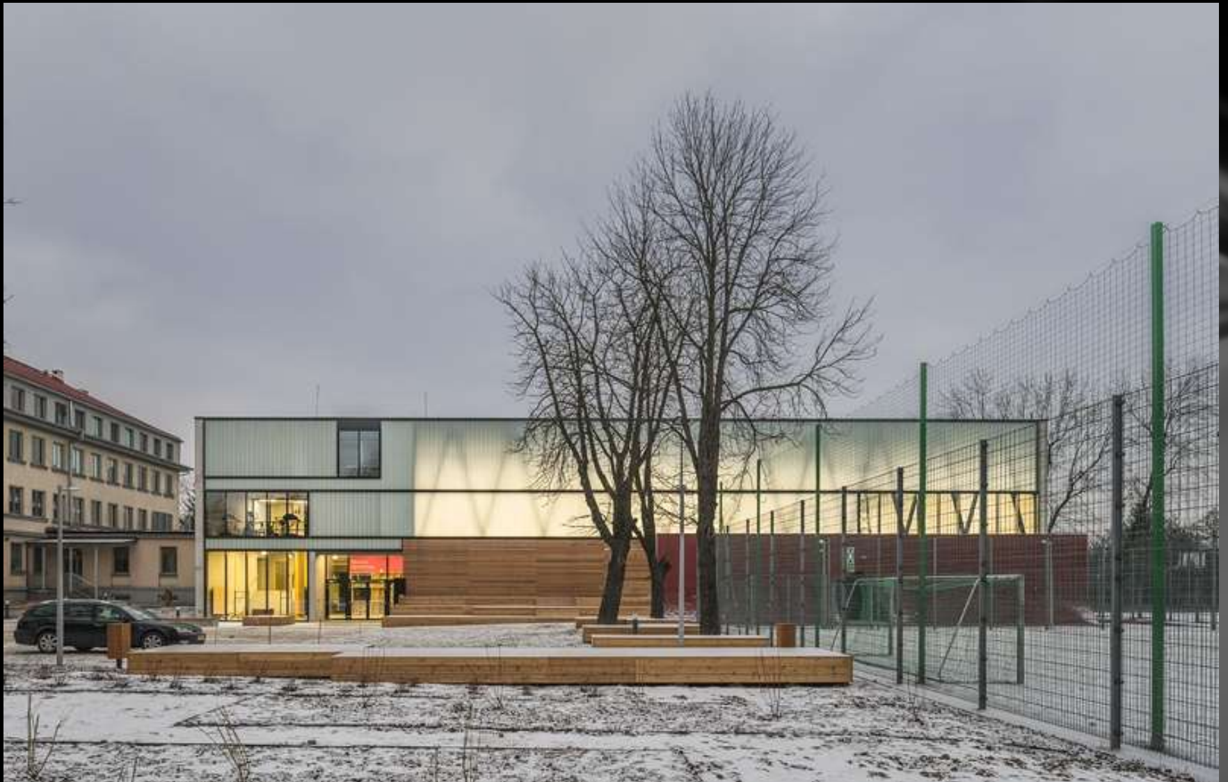
Hala Sportowa ZSOMS