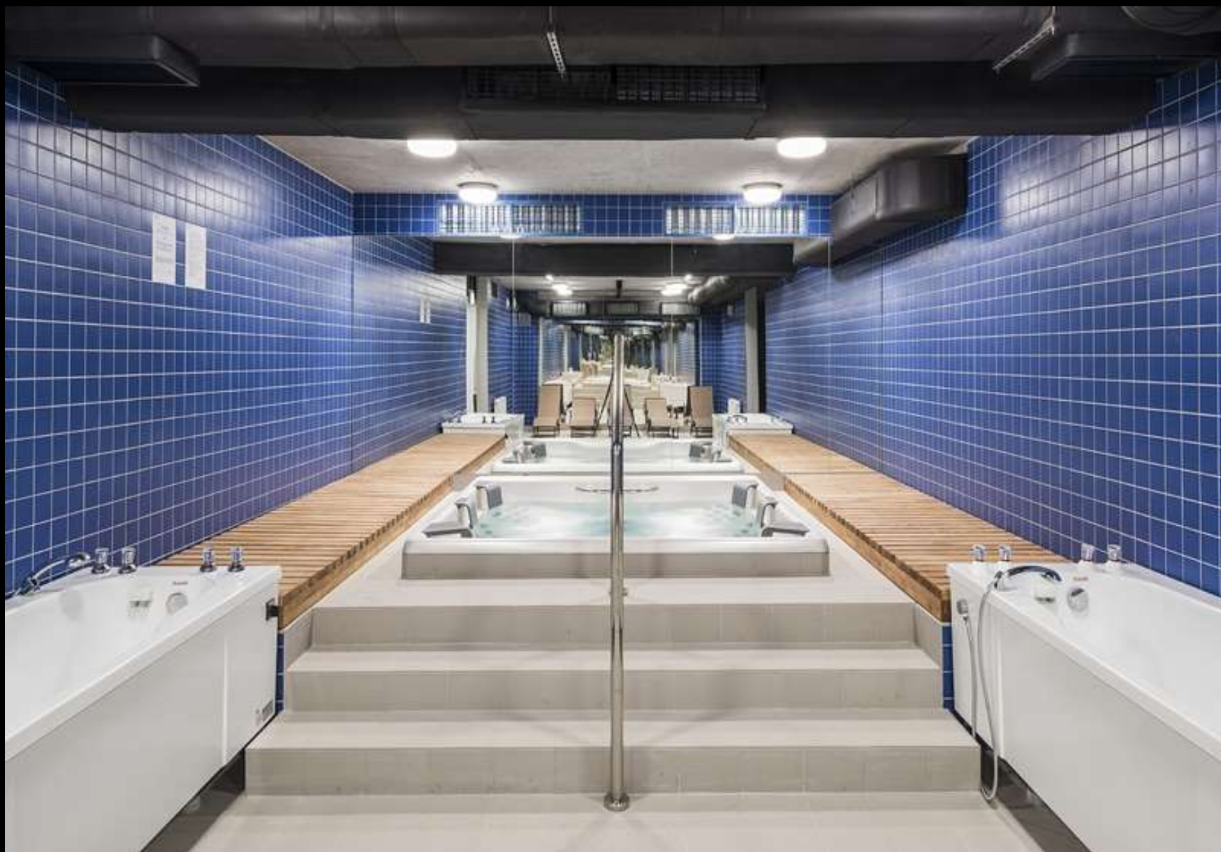
Hala Sportowa ZSOMS